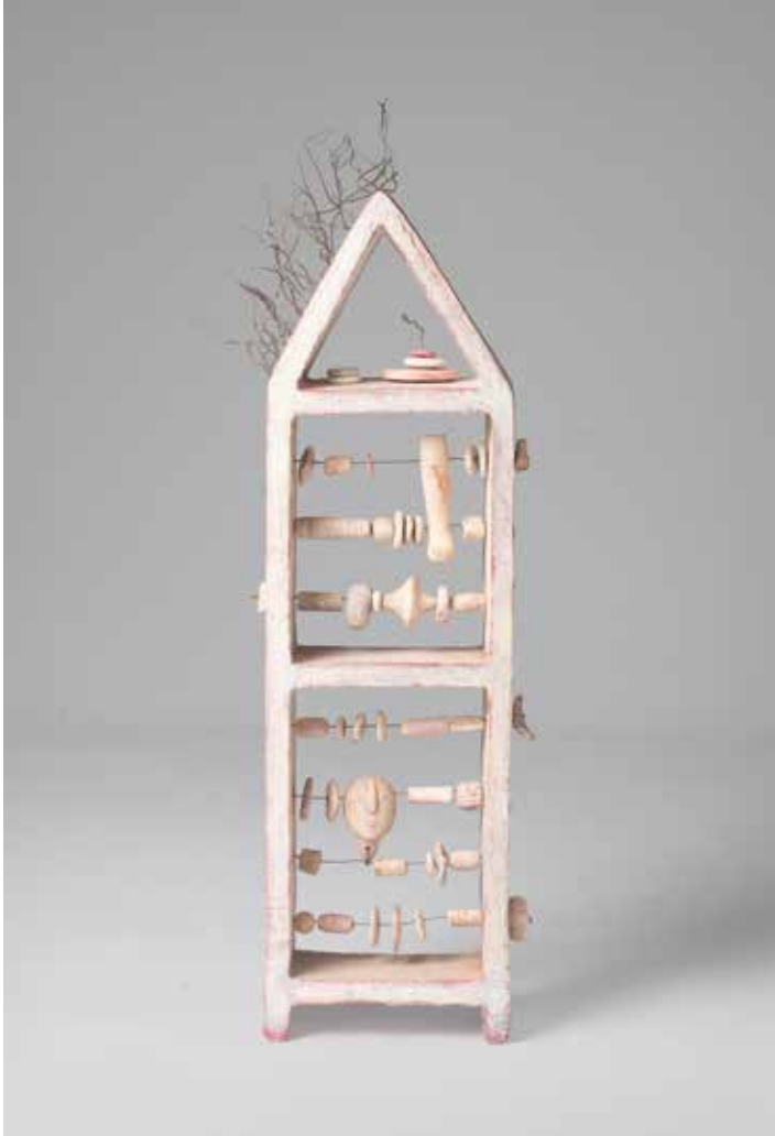
Die Herrin rechnet | weißer Ton, Draht | 17,5 x 7,5 x 67