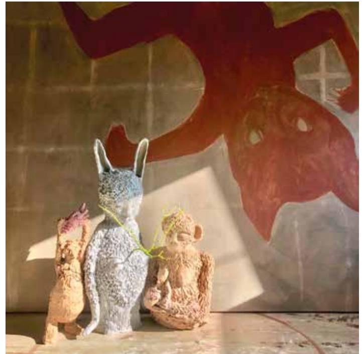
oT | keramische Plastik und Malerei | 2023-2026 | unterschiedliche Grössen...