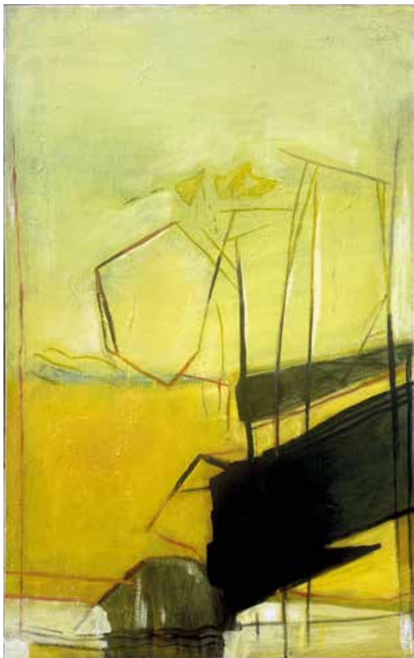
Raum | Mixed Media auf Leinwand | 2025 | 100 x 61