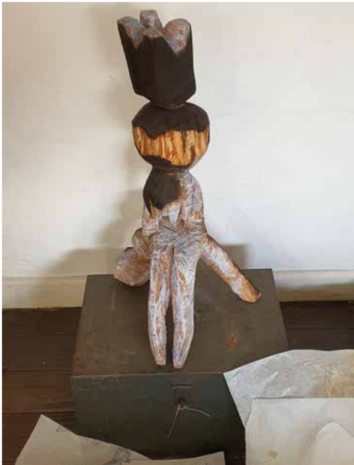
maitresse | 2026 | Weidenholz | 70 x 40 x 40