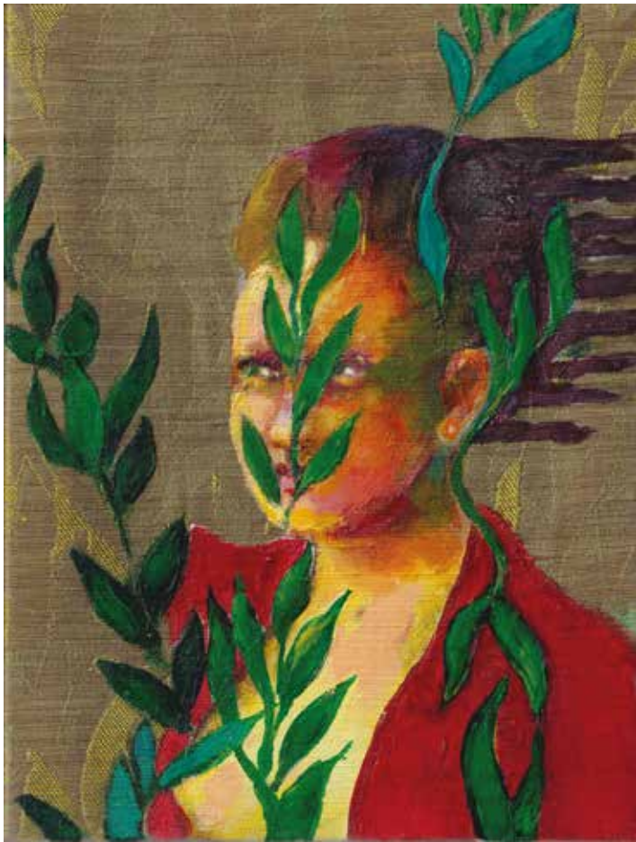
Daphne | 2025 | Acryl auf Dekostoff | 20,5 x 15,5 x 3,5