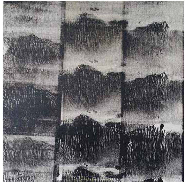
sequenz 1_1 | 2026 | Mixed Media auf Leinwand | 70 x 70

instagram@u.s.kiefen | u.s.kiefen@t-online.de