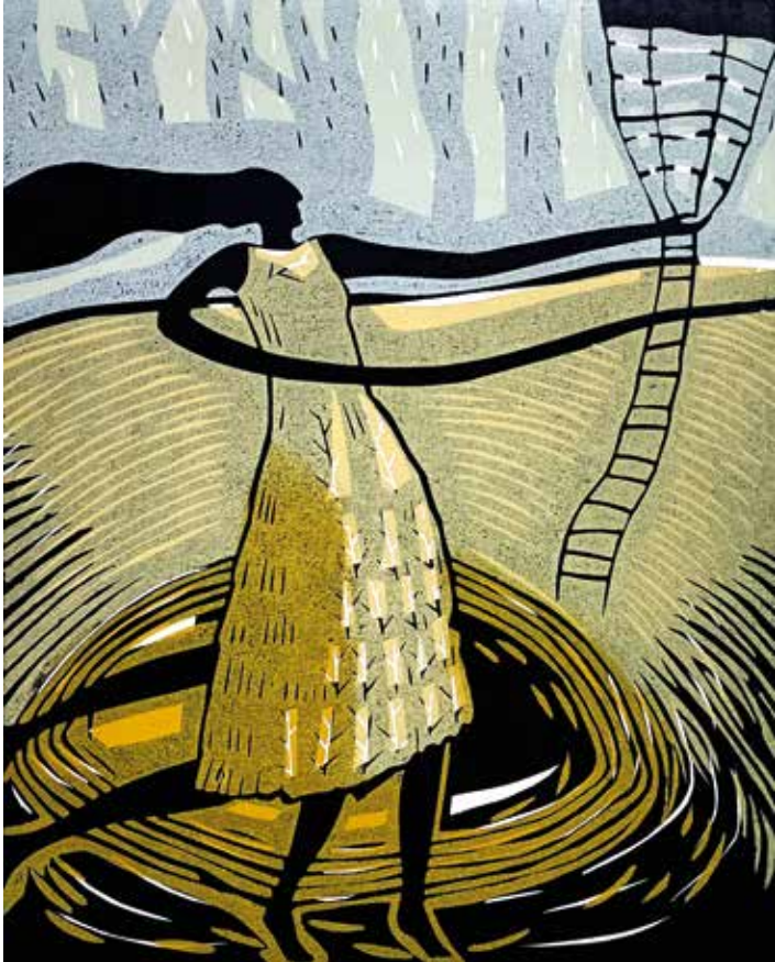
Der Brunnen | 2026 | mehrfarbiger Holzschnitt auf Bütten | Druckstock 50 x 40 | Blattgröße 60 x 48