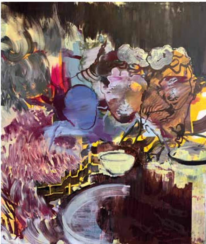
Muriel Zoe | MANGETOUT | 200 x 170 | 2025